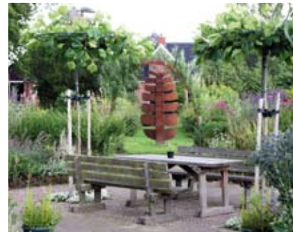
De tuin bij de Borg Ewsum in Middelstum

De gemeente Loppersum, het groene hart van Groningen, beschikt maar liefst over acht schitterende trouwlocaties. Elk met een geheel eigen karakter en uitstraling. Een idyllisch kerkje in het prachtige Hogeland, een romantische borg met een mooie tuin of het moderne gemeentehuis? U kiest zelf welke locatie het beste bij u en uw wensen past. Eén ding is zeker: als u trouwt in de gemeente Loppersum, bent u zeker van een onvergetelijke dag. De betrokken ambtenaren staan u graag met raad en daad bij om deze unieke dag tot een groot succes te maken.